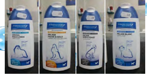
Ilustração 11 - Champô pelos longos, pêlo negro, pêlo castanho a dourado e pêlo branco

Terrier australiano - BorderCollie - Cocker Spaniel - Pequinois - Dachshound (Teckel) - GoldenRetrivier - Pastore Belga - Old english Sheepdog (Bobtail) - Spitz alemão - Samoiedo