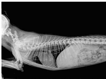
RX JIMMY - ANTES DA CIRURGIA