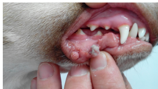
Aspeto da boca antes da cirurgia