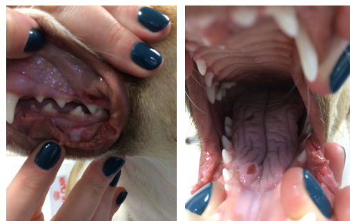
Após cirurgia de remoção total dos papilomas.

Para informações ou marcações, contate-nos: pelo 212 765 101 ou pelo e-mail: hv@ghvs.pt